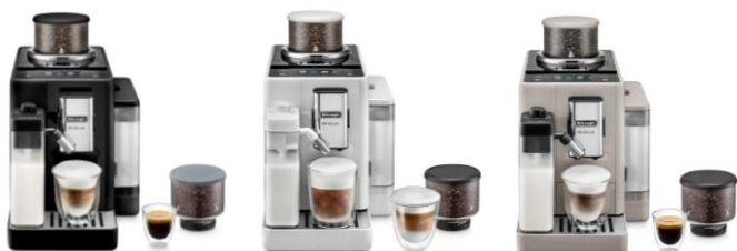
NOIR ONYX FEB4455.B